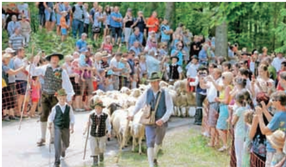
Pastirji so ovce s planin prignali v spremstvu domačih harmonikarjev.

Da so obiskovalci, ki jih je vsako leto več, lahko vsaj malo občutili pristno planinsko življenje, so Jezerjani poskrbeli tudi z domačimi jedmi, pripravljenimi na tradicionalen način, kot sta masunjek s kislim mlekom in ajdovi žganci z zeljem, glasbe in plesa željne pa je dolgo v noč zabaval ansambel Ognjeni muzikanti. Nastja Bojić