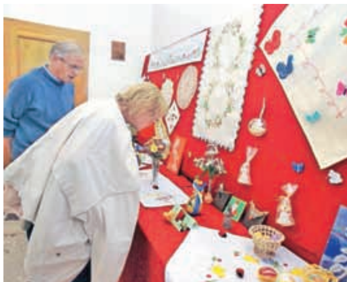
Prva skupna razstava jezerskih mojstric ročnih del je bila ob letošnjem občinskem prazniku.