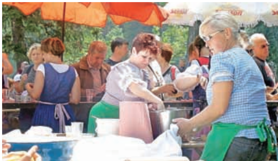
Domačini so na tradicionalen način pripravljali okusne domače jedi.