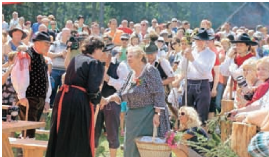
Vloge v etnološki igri so prevzeli domačini in člani KUD-a Jezersko.