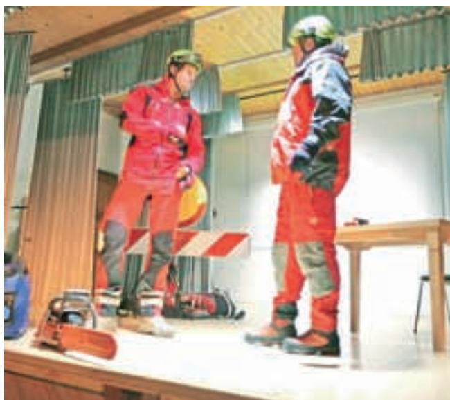
Jezerski igralci so uprizorili februarsko dogajanje, ko je bil njihov kraj zaradi žleda odrezan od sveta.

Svečanost ob praznovanju občine se je nadaljevala s slavnostno sejo ob 60-letnici Gasilske zveze Kokra in v naslednjih dneh s spominsko slovesnostjo ob dnevu državnosti na Jezerskem vrhu.