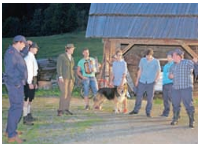
Posvet fantov pred odhodom na vasovanje