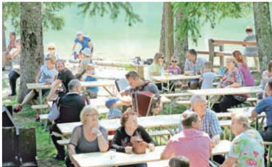
Gostje radi obiščejo Jezersko ob tradicionalnih prireditvah

Izvedli smo devet predstav Jezerska štorija v Jenkovi kasarni in vsake izmed njih se je v povprečju udeležilo okrog dvajset ljudi; nekaterih tudi več kot trideset. Mija je osemkrat predla in krtačila volno v veži Šenkove hiše in svoje znanje že pozabljene obrti prenašala na ukažljive domače in tuje obiskovalce. Dva sobotna