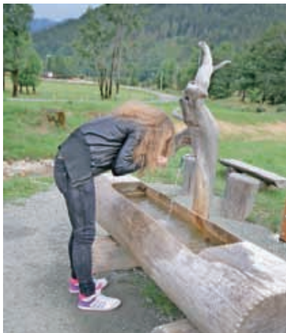
Žejni obiskovalci se radi ustavljajo ob pitniku jezerske slatine.