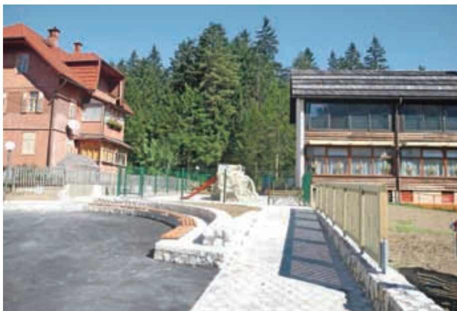
Eden od gradbenih posegov v središču Jezerskega

Še ta mesec bomo kot nadaljevanje kolesarskih počivališč po dolini Kokre zaključili projekt gradnje štirih počivališč do mejnega prehoda - pri Macesnovskem mostu, pri cerkvi Sv. Andreja v Ravnem, na prvi serpentin in na nekdanjem mejnem prehodu.