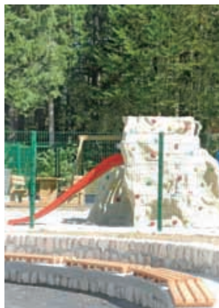
Poskrbeli smo tudi za najmlajše.