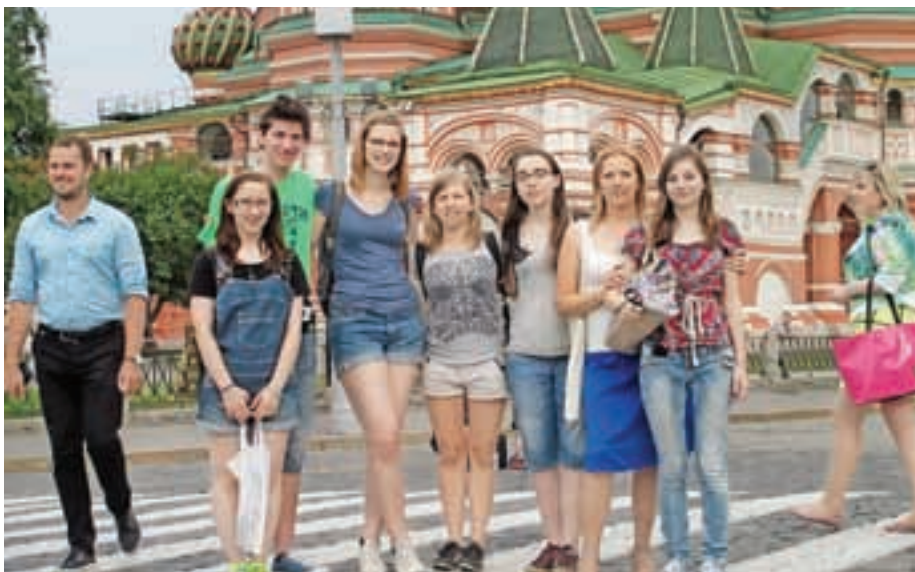
Udeleženci olimpijade v znanju ruskega jezika v Moskvi